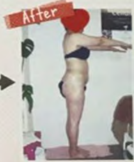
Aさん (54歳) 10回施術